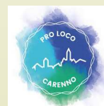
Pro Loco di Carenno