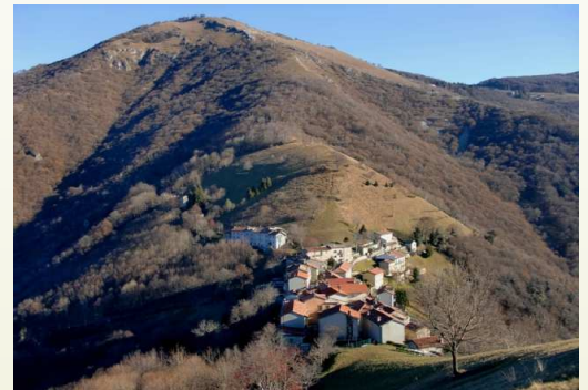
Colle di Sogno e il Monte Tesoro

Ecco qui. Un foglio o due, non di più, con il quale potremo restare in contatto reciproco, avere le informazioni su